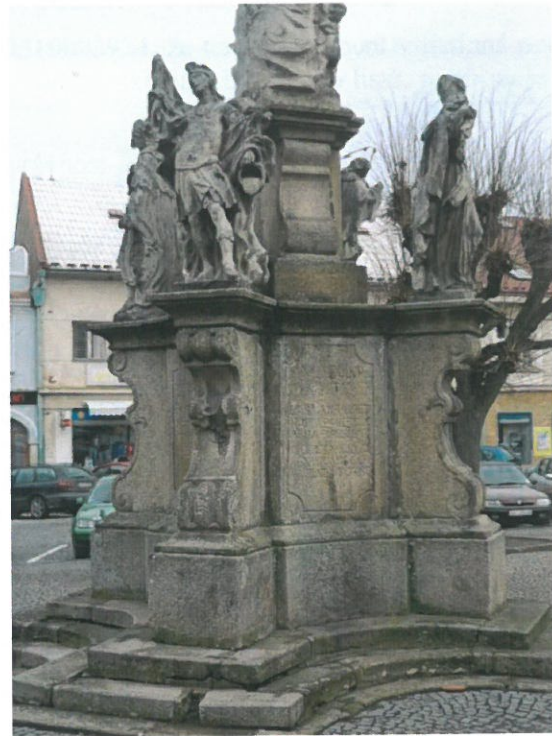
Ledeč nad Sázavou, Mariánský sloup, celkový pohled od JV, detail schodiště a hlavního podstavce se sochami (Šlězová 01/2016)